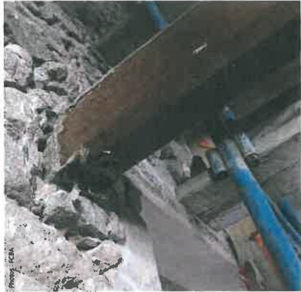
◀ ▶ ▲ Exemples de dégâts causés par le champignon à l'intérieur de l'église.

avait une importante dissémination de spores. Une catastrophe pour cette paroisse qui accueille 365 jours par an ses fidèles et visiteurs de passage.