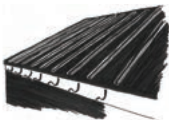
Figure 4 : Ecran de sous toiture exposé aux UV

Pour les planchers, il existe des membranes adhésives dont le rôle est de protéger l'ensemble des surfaces. Celles-ci sont facilement utilisables et mises en place en atelier de préférence. Elles pourront ainsi constituer une protection lors du transport.