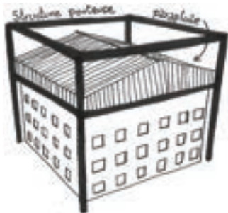
Figure 3 : Parapluie de chantier

Peu courantes, car complexes et onéreuses, les protections générales comme le chapiteau ou le parapluie sont des technologies permettant de couvrir l'ensemble de la zone de chantier. Ces derniers sont généralement réalisés avec une structure métallique, une toile et peuvent intégrer un pont roulant en tête, des plateformes périphériques, etc. Le chapiteau est fixe, tandis que le parapluie monte au fur et à mesure de la construction des étages.