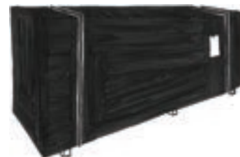
Figure 1 : Lot de bois convenablement stocké

En ce qui concerne les panneaux dérivés du bois jouant un rôle structurel, nous vérifions les déclarations de performances associées (OSB 3/ OSB 4/ Panneau de particule P5/P7 travaillant en milieu humide...)