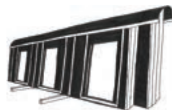
Figure 2 : Stockage de murs ossature bois avec protection des en-têtes

Pour le stockage des murs ossature bois, à la verticale nous préconisons une protection provisoire renforcée en tête de murs, qui constitue un point critique pour la pénétration d'eau, à conserver lors du transport. Lorsqu'un module 3D est chargé sur un camion, le plancher haut doit être protégé et muni d'un bâchage efficace.